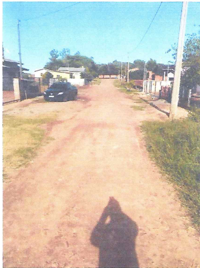
Rua: das Saracuras Bairro Gaucho